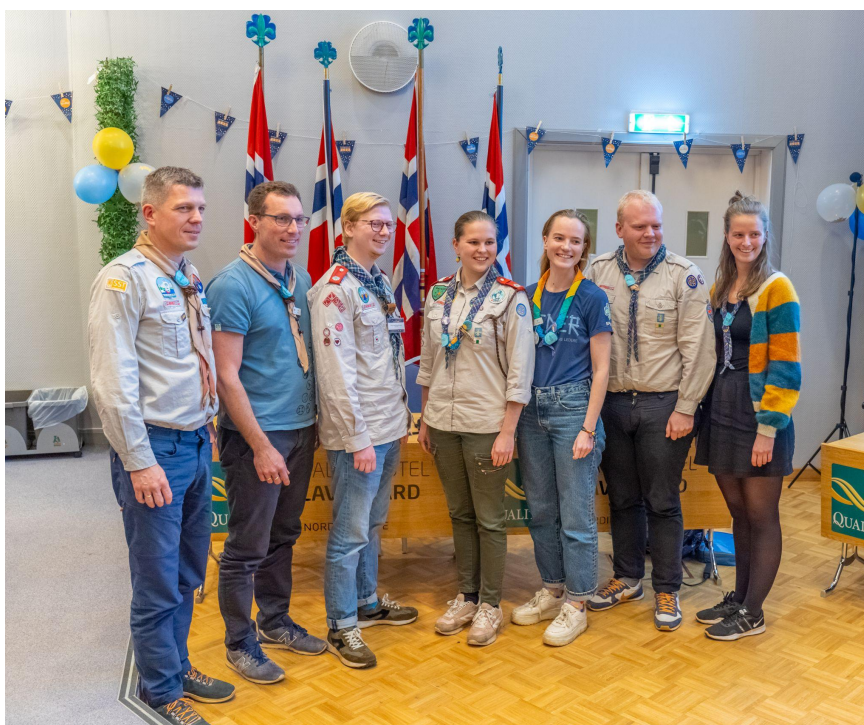
Det nyalvalgte Speiderstyret 2022: