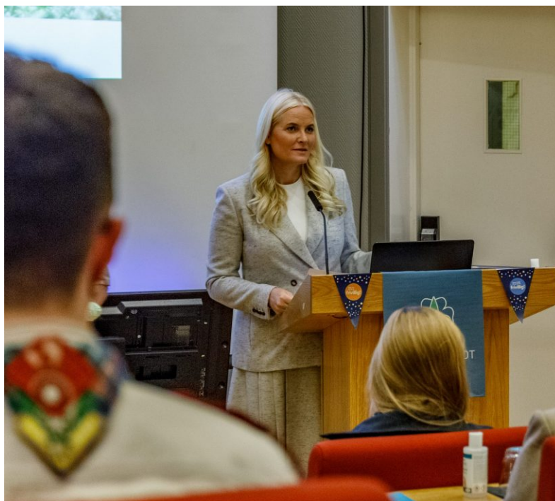
HKH Kronprinsesse Mette-Marit besøkte Speidertinget i 2022 og uttalte: «Jeg tror at verden ville vært et bedre sted, hvis flere hadde vært speidere!»