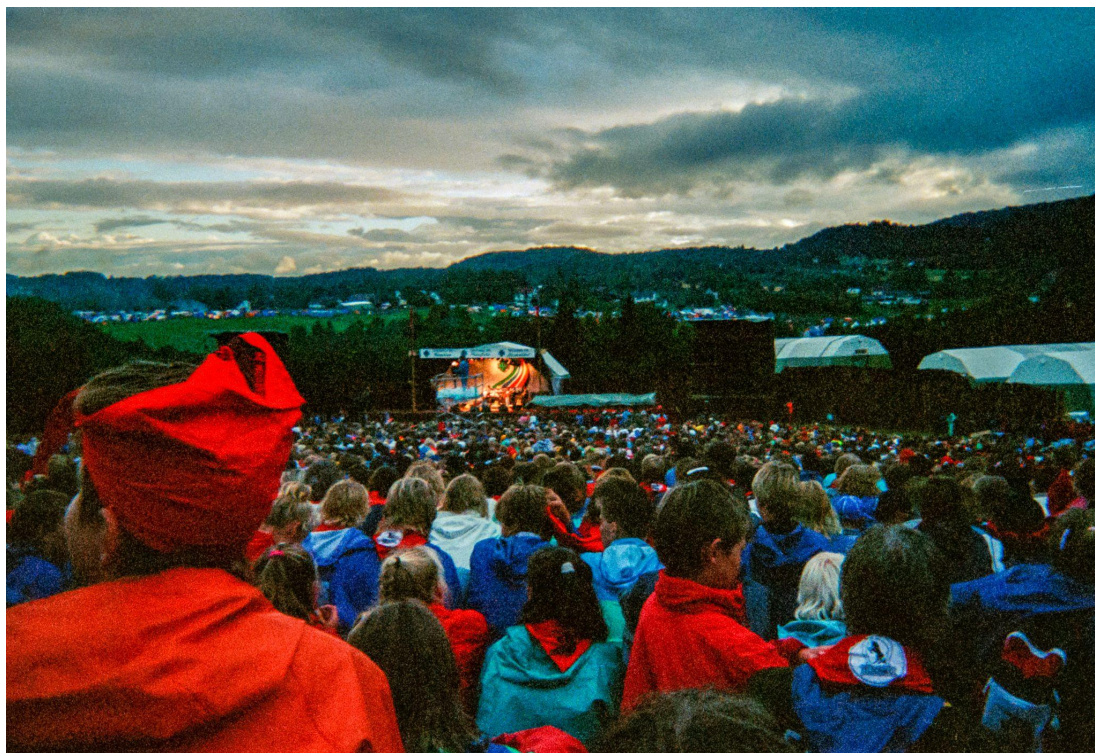
Det var 19090 deltagere på landsleiren på Skaugum i 1989.