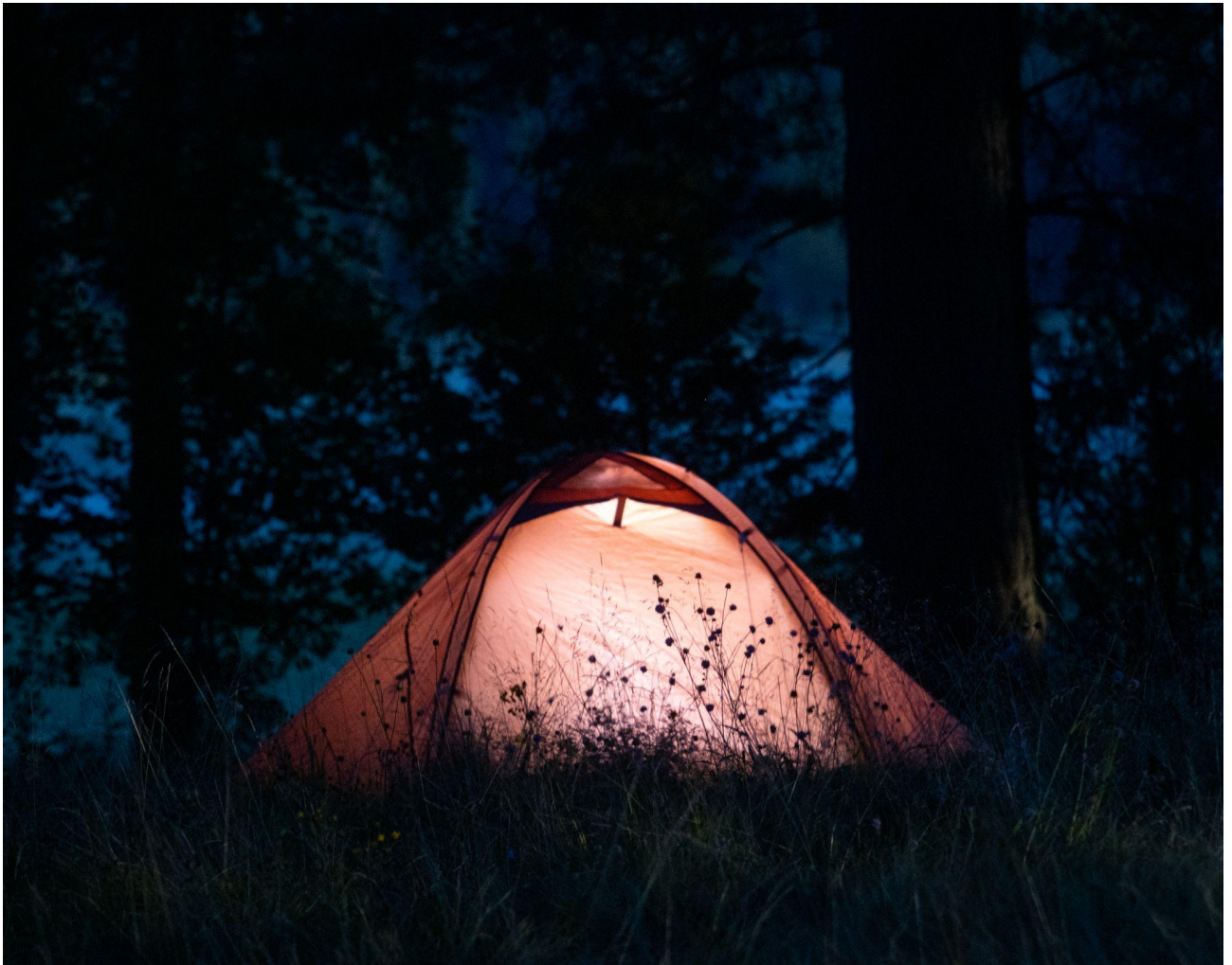
Lys i mørket