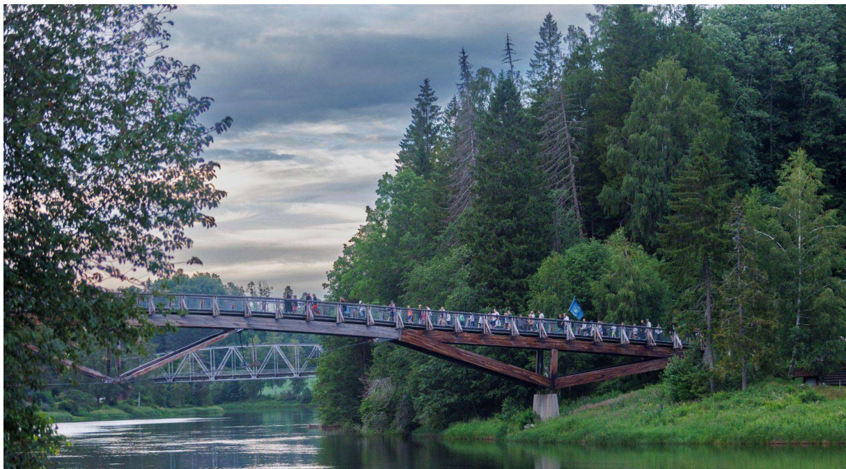
Alle som gikk over brua på kretsleiren husker bevegelsene i brua. Kun 50 personer fikk lov til å gå over, før neste gjeng på femti, kunne gå på brua.