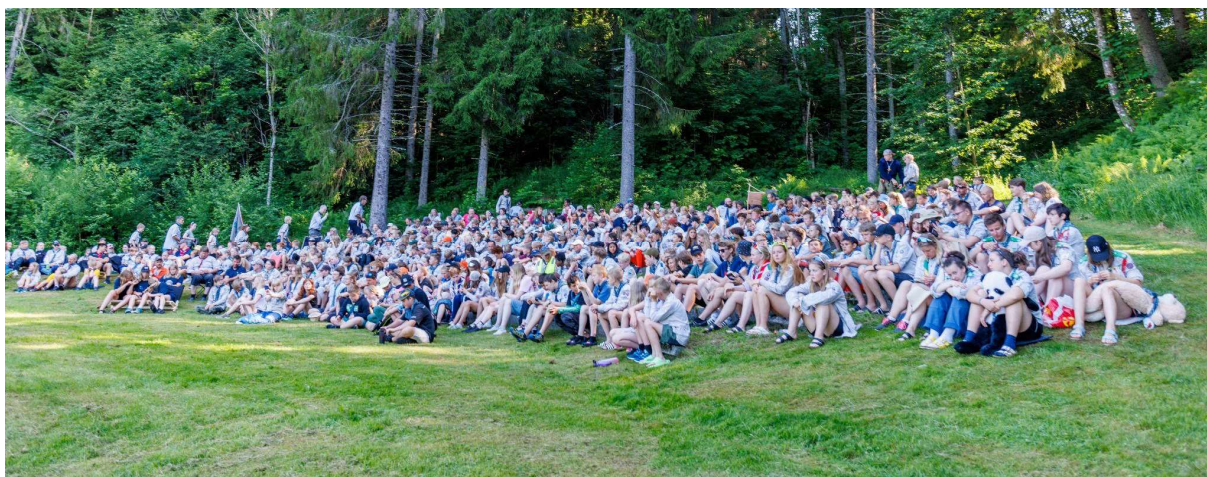
Alle sammen på kretsleiren i 2023